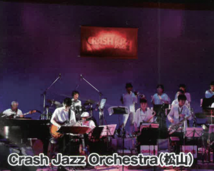
Crash Jazz Orchestra(松山)

※新型コロナウイルスの影響により、事業内容が変更になる可能性がありますことをご承知ください。ご来場の際は必ずマスク着用、検温のご協力をお願いいたします。3密回避等の十分な対策を行います。