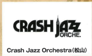
Crash Jazz Orchestra(松山)

ピアノ教師の母の影響で幼少からピアノを始め、大阪音楽大学に進学。在学中にジャズに触発されNYへ移住。本場の生活に触れたことが現在の歌唱に多大な影響を与えている。帰国後、様々なジャンルの音楽を経験し、ジャズシーンに復帰。ダイナミック且つ繊細で人間味溢れる歌唱は多くのオーディエンスに支持を得ている。2016年 第36回浅草ジャズコンテストホール部門金賞受賞。大阪芸大、名古屋芸大講師。